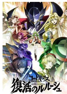
Code Geass: Fukkatsu no Lelouch