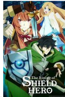
Tate no Yuusha no Nariagari