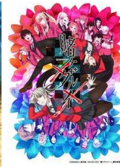
Kagegurui 2. évad