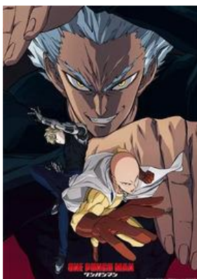
One Punch Man 2. évad