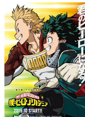
Boku No Hero Academia 4. évad