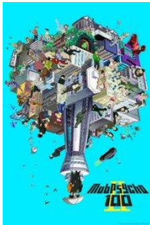
Mob Psycho II

2018 december – 2019 január 5 legnézettebb animéje: